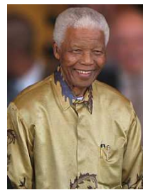
Ο Νέλσον Μαντέλα

1994, ο Νέλσον Μαντέλα ορκίστηκε πρόεδρος, σε ηλικία 77 ετών. Ως πρόεδρος, ο Μαντέλα δούλεψε για το καλό του λαού της χώρας,